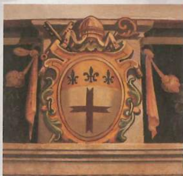
L'insegna araldica dei Della Croce