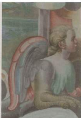
Particolare affresco interno