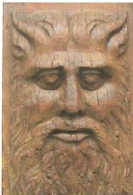
Mascherone della porta laterale